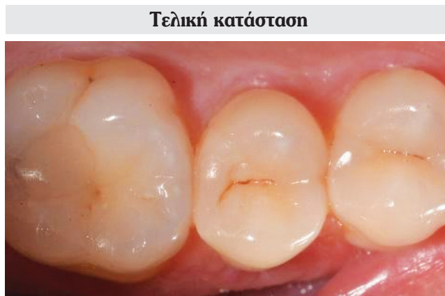
Εικ. 8: Το αποτέλεσμα της θεραπείας μετά από 2 μήνες.