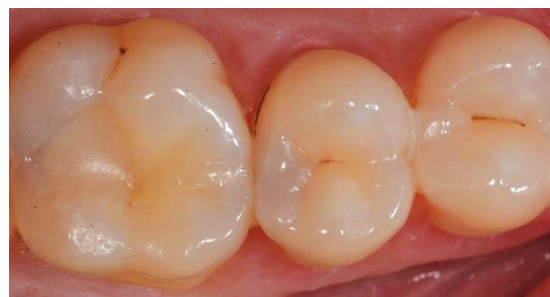
Εικ. 1: Αρχική κατάσταση με την ευρεία τερηδονική αλλοίωση στην άνω επιφάνεια του δεύτερου προγομφίου.

Γι' αυτό κάθε οδοντίατρος θα πρέπει να αποφεύγει να αφιερώνει πολύ χρόνο στην επιλογή απόχρωσης σε αυτές τις περιπτώσεις και να εστιάζει στους παράγοντες που επηρεάζουν την αξιοπιστία και τη μακροζωία της αποκατάστασης. Μεγάλη υποστήριξη για την ολοκλήρωση αυτής της εργασίας προσφέρει το CLEARFIL MAJESTY™ ES-2 Universal, μια σύνθετη ρητίνη με μία διεθνή απόχρωση (U) για την οπίσθια περιοχή που εξαλείφει την ανάγκη λήψης και επιλογής απόχρωσης. Ταυτόχρονα, προσφέρει καλή οριακή προσαρμογή, χαμηλή τάση συρρίκνωσης και υψηλή αντοχή στη φθορά που απαιτούνται για εξαιρετικά μακροπρόθεσμα αποτελέσματα.