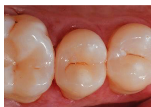
Εικ. 7: Το αποτέλεσμα της θεραπείας αμέσως μετά την αφαίρεση του ελαστικού απομονωτήρα. Το εγγύς σημείο επαφής είναι σφιχτό και η ανατομία της μασπτικής επιφάνειας καλά διαμορφωμένη σύμφωνα με την ατομική μασπτική δυναμική του ασθενούς. Το όριο της αποκατάστασης είναι ουσιαστικά άορατο, ενώ το παρεϊακό φύμα είναι πιο ανοιχτό λόγω της αφυδάτωσης του φυσικού οδοντικού ιστού.