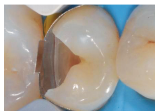
Εικ. 3: Τοποθέτηση τμηματικού τεχνητού τοιχώματος και σφήνας. Και τα δύο συγκρατούνται από ένα δακτύλιο, που αυξάνει το μεσοδόντιο χώρο και έτσι εξασφαλίζει τα στενά και ανατομικά σωστά σημεία επαφής.