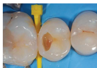
Εικ. 4: Σχηματισμός του άνω τοιχώματος με CLEARFIL MAJESTY™ ES-2 Universal (U απόχρωση) που ακολούθησε την επιλεκτική αδροποίηση της αδαμαντίνης με φωσφορικό οξύ (K-ETCHANT Syringe) και συγκόλληση με CLEARFIL™ SE Bond.