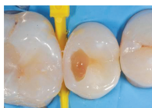
Εικ. 5: Ένα λεπτό στρώμα λεπτόρρευστης σύνθετης ρητίνης (CLEARFIL MAJESTY™ ES FLOW High) τοποθετείται στο έδαφος της κοιλότητας ως επικάλυψη ρητίνης.