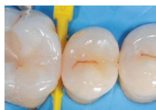
Εικ. 6: Η αποκατάσταση ολοκληρώθηκε με CLEARFIL MAJESTY™ ES-2 Universal (U απόχρωση). Ενώ η διεθνής απόχρωση της σύνθετης ρητίνης χάνεται μέσα στον περιβάλλοντα οδοντικό ιστό, η φυσική εμφάνιση ολοκληρώνεται προσθέτοντας μια μικρή καφέ απόχρωση στις οχισμές του δοντιού.